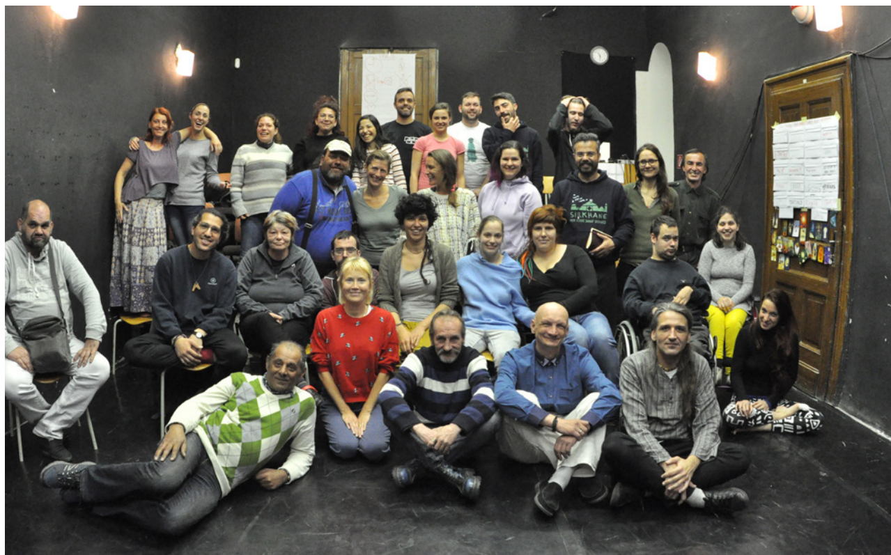
PROJEKT — 2018